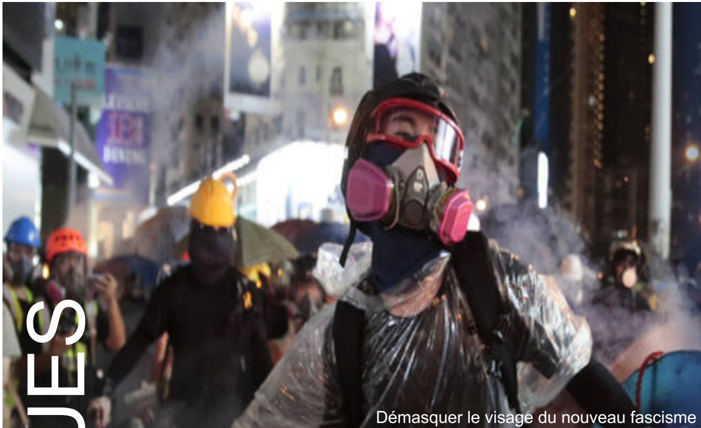
Démasquer le visage du nouveau fascisme